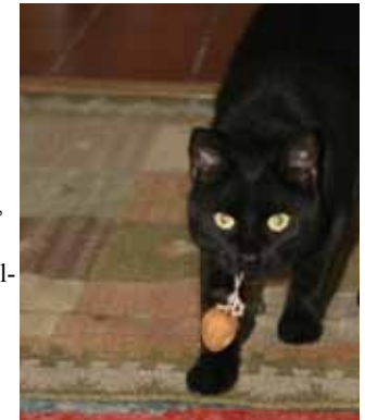
...einst auf einer unserer Pflegestellen, heute geliebter Herzensschatz - unser „Experte“ (siehe S. 14 oben)

Außerdem ist geplant, auf Schloss Arenfels im Schlossgarten an einigen Sommer-Sonntagen einen kleinen Mode-/Echtschmuckmarkt zu veranstalten. Näheres und Termine werden kurzfristig auf HP und FB veröffentlicht.