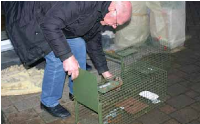
Bei einer großen Fangaktion haben unsere ehrenamtlichen Helfer die Lebendfallen mit Futter bestückt, um die Katzen einzufangen und zur Kastration zu bringen.

in der Wüste. Es fehlen Fahrer, die ab und zu Transporte von Tieren zu den Arztpraxen übernehmen können, Helfer, die uns bei den Basaren und Flohmärkten unterstützen, – vor allem Transporteure/Aufbau/Abbau – sowie Pflegestellen, die Katzen bei sich aufnehmen können. Ehrenamtliche Arbeit braucht nicht nur Zeit, sie tut einfach gut!!! Nicht nur den Geretteten, sondern den Helfern selbst.