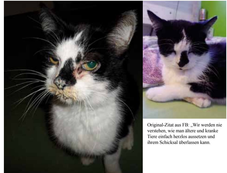
Original-Zitat aus FB: „Wir werden nie verstehen, wie man ältere und kranke Tiere einfach herzlos aussetzen und ihrem Schicksal überlassen kann.“

Tragisch endete leider der Fall des kurz vor Weihnachten an einem Park & Ride-Parkplatz in elendem Zustand ausgesetzten Katers. Ein aufmerksamer Autofahrer hatte den schwarz-weißen Kater entdeckt, der dort stundenlang neben einem durchweichten Pappkarton ausgeharrt hatte. Liebevoll zuerst vom Tierarzt, dann von der Pflegestelle gepöppelt, erholte sich Clooney, wie er getauft wurde, anfangs sehr gut. Leider versagten dann seine Nieren, und Clooney trat seine letzte Reise über die Regenbogenbrücke an.