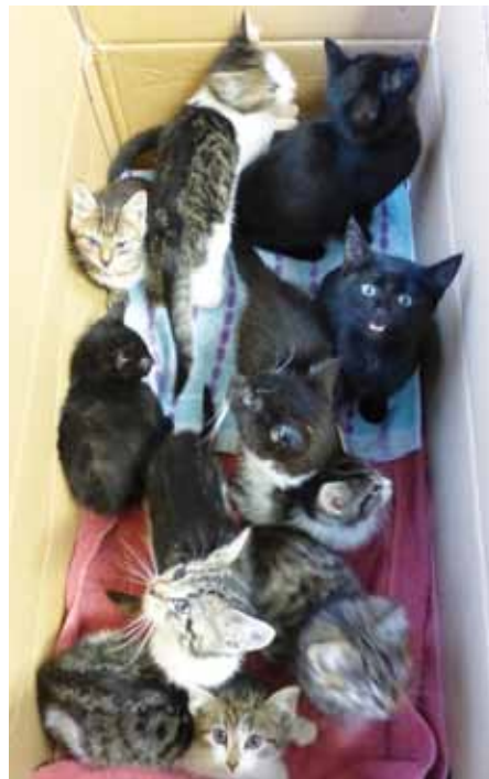
Hier sind Zehn der Eiseheid Kätzchen, direkt nach ihrer Ankunft und dem ersten Check in der Tierarztpraxis.

Durch die Presse und ebenfalls über Facebook ging der Fall von zwölf im Dezember 2014 ausgesetzten Katzenkindern, die eine unerschrockene Katzenfreundin an einer belebten Durchgangsstraße in Eiseheid entdeckte, aus dem Auto stieg und sofort mutig eine Rettungsaktion startete. Die Kätzchen kamen in unsere Obhut und sofortige tierärztliche Behandlung, da sie allesamt krank und in einem erbärmlichen Zustand waren. Es dauerte, bis alle gesundheitlich stabilisiert waren, auf Pflegeplätzen gepöppelt und später dann vermittelt werden konnten. Danke auch hier für die tolle Spendenbereitschaft zu Gunsten der kleinen Überlebenskünstler!